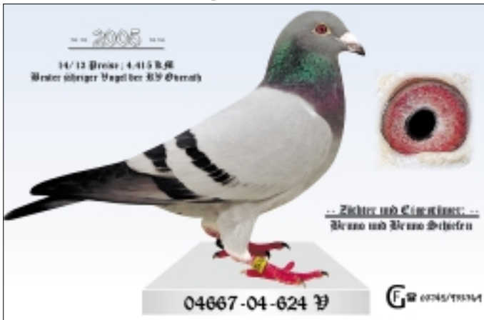
Ebenfalls einer der Leistungsträger ist der 04667-04-624, als Jähriger bereits 13 Mal erfolgreich und bester seines Jahrganges in der RV Overath.