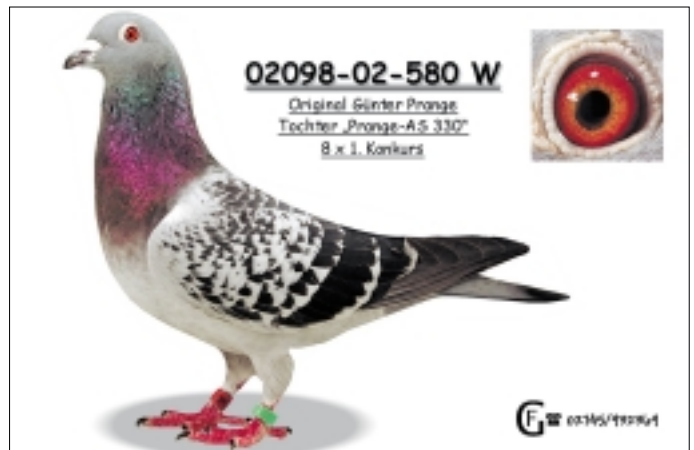
Auch sie vertritt den Brieftaubenadel aus Meppen: die „580“, direkte Tochter des „330“ mit seinen acht ersten Konkursen.