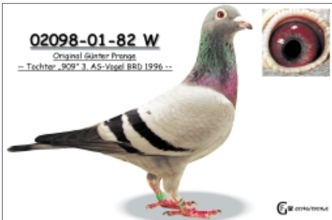
Eine der Zuchtsäulen des Schlages ist die „82“, gezogen von Günter Prange aus dem „909“, dritter Ass-Vogel BRD 1996.