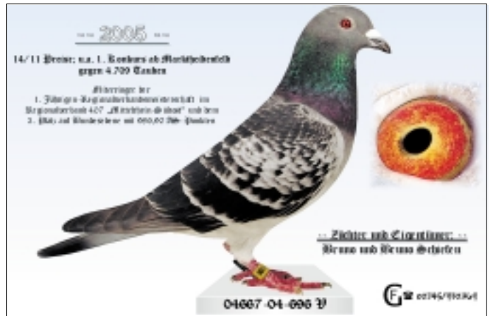
Einer, der auch auf nationaler Ebene bereits Erfolge erzielte: der „696“ war mit seinen 11 Preisen u. a. Miterringer der 3. Jährigenmeisterschaft auf Bundesebene.

3. Platzes auf Bundesebene. Gezogen wurde er aus zwei originalen Bellens-Tauben. Der 04667-04-624 brachte es in 2005 auf 13 Preise und wurde damit bester jähriger Vogel der RV Overath. Er stammt aus einem Sohn des Koopman-Vererbers „Gerard“ und der „83“ sowie einer Tochter des „Louis“ (Original Deleus) mit der „286“ (aus Sohn „Vorrui“ mal „999“).