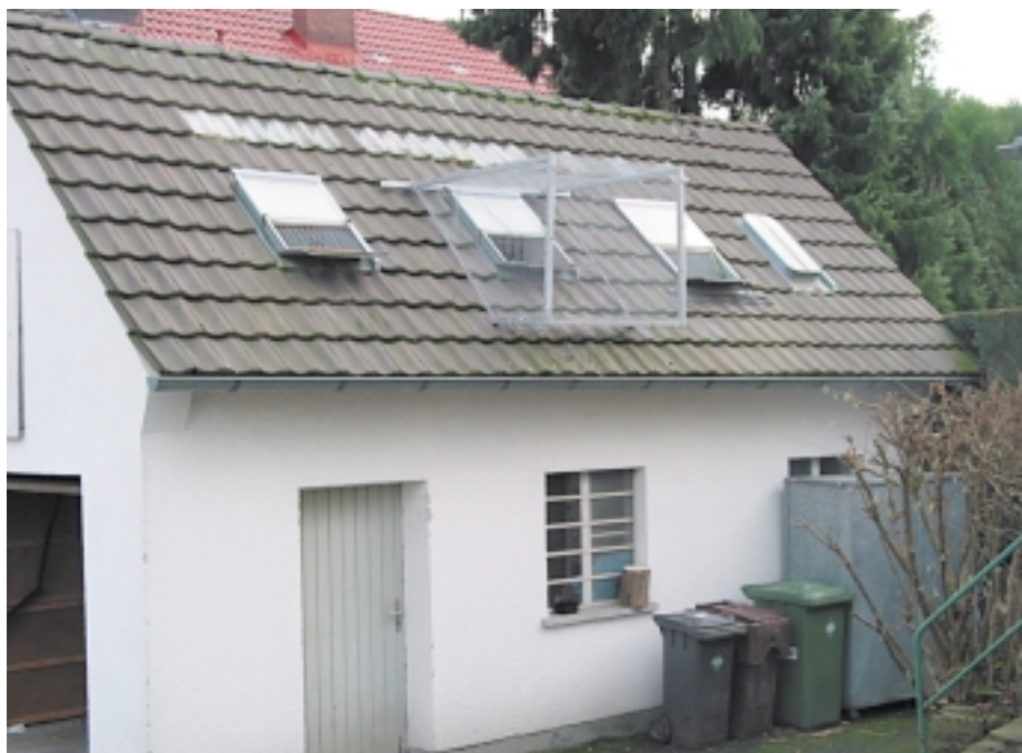
Im Dachboden dieser Garage sind die Witwer des Juniors Schiefens untergebracht. Zwei Schläge auf einem Grundstück, jeder ist für seine Mannschaft verantwortlich. Gesunde Rivalität innerhalb einer Schlaggemeinschaft.

Die beiden Schiefens sind auf einem guten Weg, ihr selbst gestecktes und recht anspruchsvolles Ziel zu erreichen.