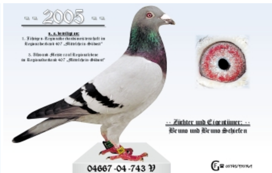
Er komplettiert den goldenen Jahrgang 2004 auf dem Schlag Schiefen: Der „743“ war mit seinen Spitzenleistungen sehr eindrucksvoll an allen Erfolgen beteiligt.

Die Koopman-Linie wird hier vertreten durch die „NL 01/582“, eine Tochter des „Jacco“ mal Schwester „Noble Blue“. Natürlich dürfen auch hier eine Tochter des „Kannibaal“ sowie zwei Töchter eines Sohnes des „Kannibaal“ nicht fehlen.